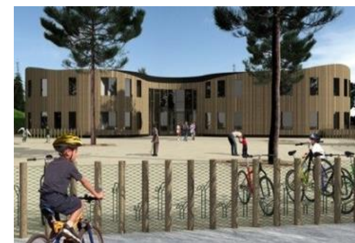
Ons schoolgebouw en voorplein

Het jaarverslag van Stichting Delta vindt u onder : www.deltadebilt.nl/jaarverslagen/