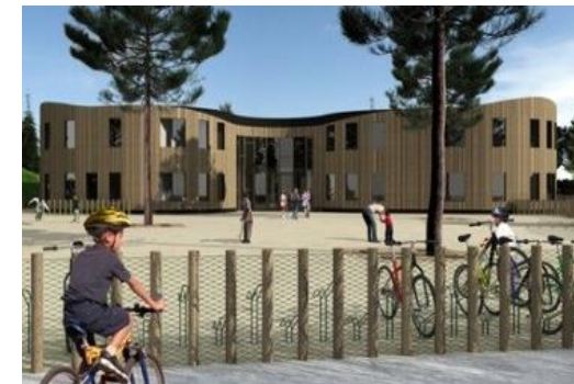
Ons schoolgebouw en voorplein